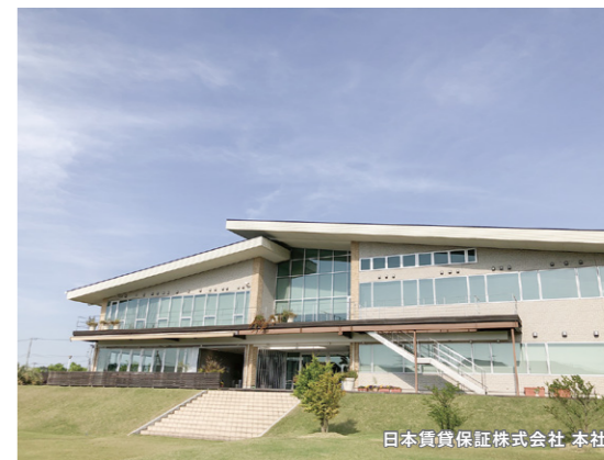
日本賃貸保証株式会社 本社

木更津に本社を移転し早13年。今でも、お客様に『どうして木更津に本社を構えているんですか?』とよく聞かれます。JIDは1995年に横浜で事業開始以降、東京に本社を移し、全国に賃貸保証システムを普及させるべく活動をして参りました。事業がまだまだ知られていない当時、全国展開をするにあたり本社を東京に設置することが重要なファクターでした。しかし、賃貸保証事業を通じて、扱いに困る残置物等の問題に直面し、入居者様・家主様へのサービスを拡充するため、2011年に本社移転を決定いたしました。