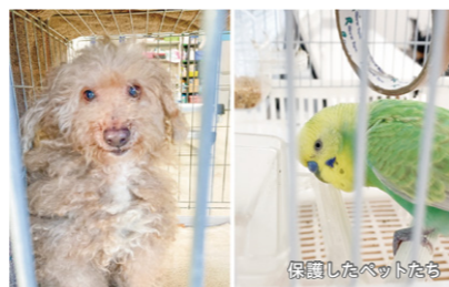
保護したペットたち

明け渡し後、もう飼えないペットがお部屋に取り残されることも。そのままでは保健所に連れていかれてしまうところ、JIDではペットを一時保護しています。衰弱している場合には木更津のNPO法人に協力を仰ぎ、回復するまでお世話をし、その後は里親探しまで行っています。これまで保護した、犬・インコ・ウサギなどが、新たな飼い主の元で元気に暮らしています。