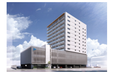
[2025年3月竣工予定の新社イメージ]